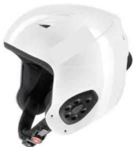
Beispiel: Schutzhelm mit Vollschale und Höröffnung