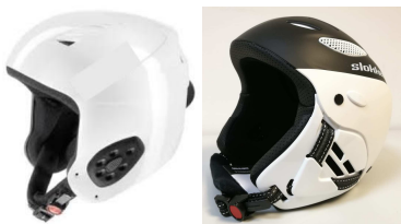
Beispiele: Helm mit Vollschale und Höröffnung