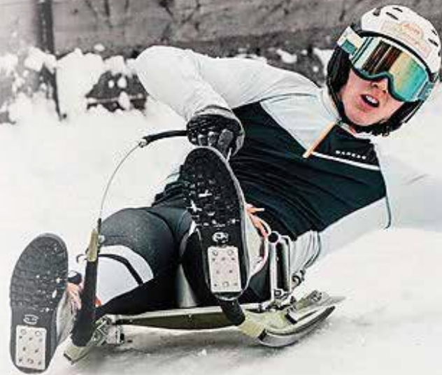
Sebastian Feldhammer/SV St. Sebastian